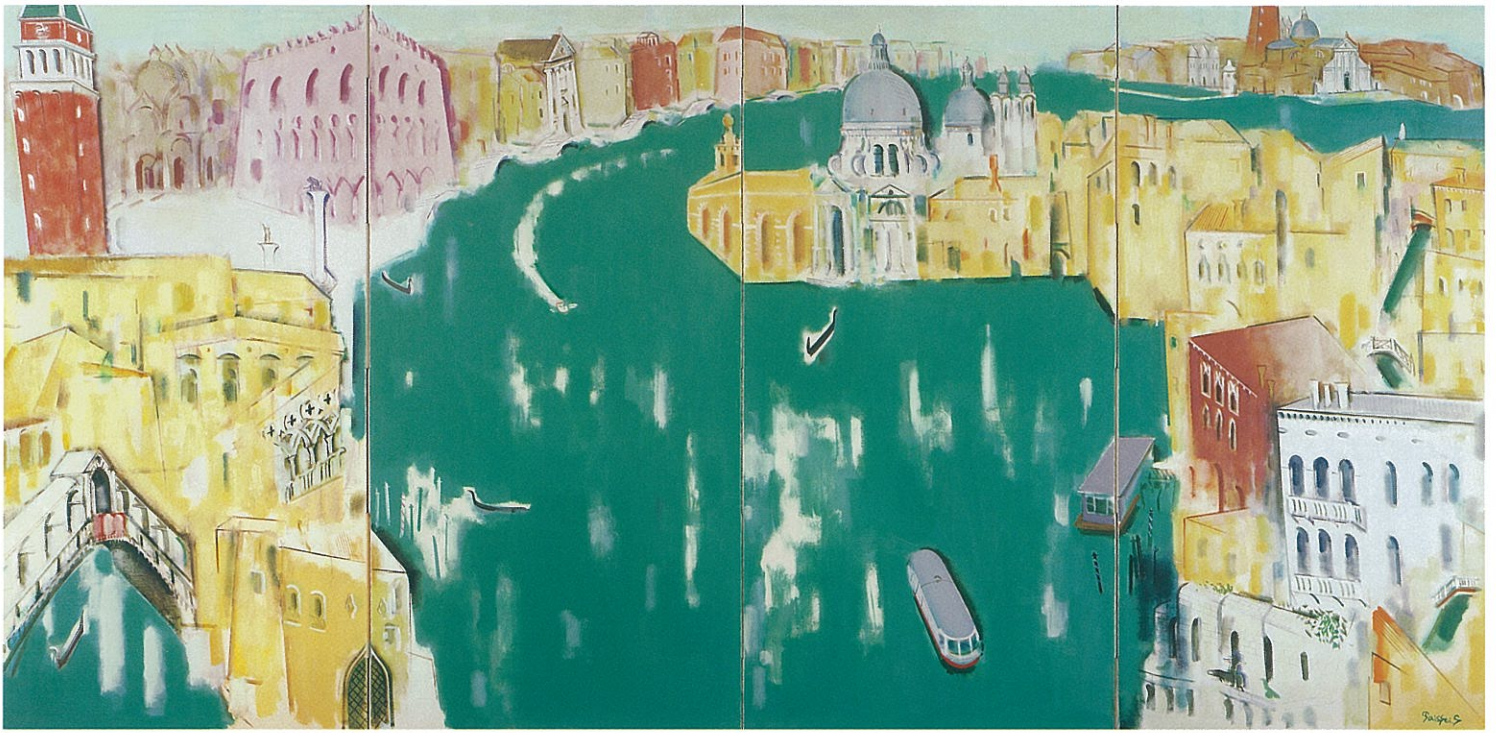
佐藤泰生〈ベニス〉1989年 油彩・カンバス