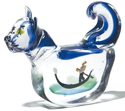
佐藤泰生の原画による《猫の中のベニス》2009年 ガラス