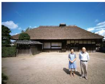
茨城県水戸市渋井町 1990年