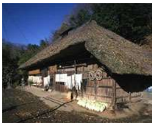
茨城県筑西市(旧下館市)2006年