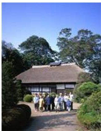
茨城県常陸大宮市(旧山方町)1993年

柳下征史(やぎしたせいし)は、茨城県常陸大宮市を拠点に活動した記録写真家です。茨城の原風景をテーマに写真を撮り続け、特に草屋根の家を中心に、ワラ葺きや茅葺きの民家を探し歩いて撮影。日立製作所で広報誌の制作に携わる傍ら、世界的な写真家ユージン・スミスとの出会いを経て写真家として独立しました。この度は遺族にご協力を賜り、ひだまりの暖かさを感じさせる写真作品を、企画展示館 2 階会場にて紹介します。