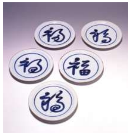
北大路魯山人「そめつけ福字平向」1937年頃