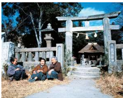
茨城県那珂郡山方町西内野 1989年