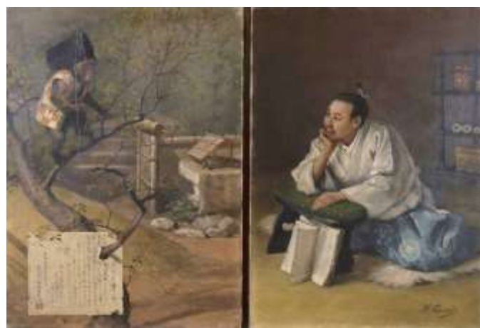
二世五姓田芳柳「上杉景勝一笑図」1890年